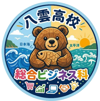
↑総合ビジネス科アカウントロゴ（生徒作成）

今年度より、公式SNSアカウント（Instagram）を作成しました。リアルタイムで総合ビジネス科が投稿を行います。ぜひ、フォローしてください。